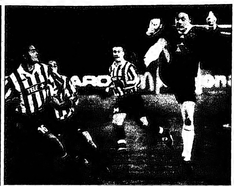
ابن الكرة مناصفة بين لاعبي يوفنتوس وفرنسيين في الدوري الإيطالي من تأهل لها الكرة (اليسار)